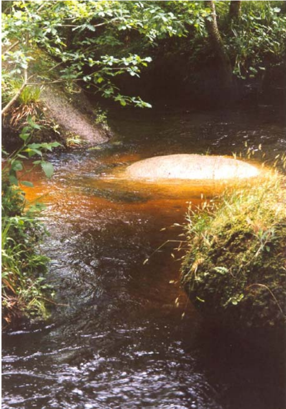
Magische stenen in Huelgoat Bretagne. Gewone grijze keien in de rivierbedding, todat de zon gaat schijnen.....